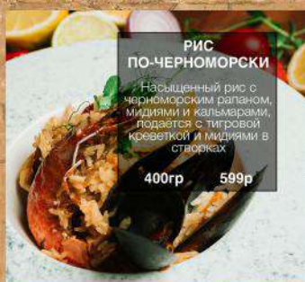
РИС ПО-ЧЕРНОМОРСКИ Насыщенный рис с черноморским рапаном, мидиями и кальмарами, подается с тигровой креветкой и мидиями в створках 400гр 599р

ЧЕРНОМОРСКАЯ УХА Три вида рыбы, подается с целым раком и зеленью 580гр 599р